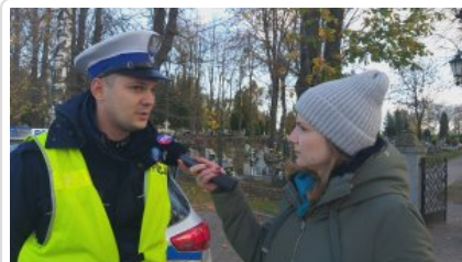
AKCJA ZNICZ 2019 - Policjanci apelują!

Aby obejrzeć film włącz obsługę JavaScript w swojej przeglądarce.