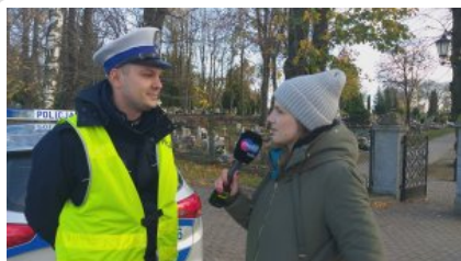
AKCJA ZNICZ 2019 - Policjanci apelują!